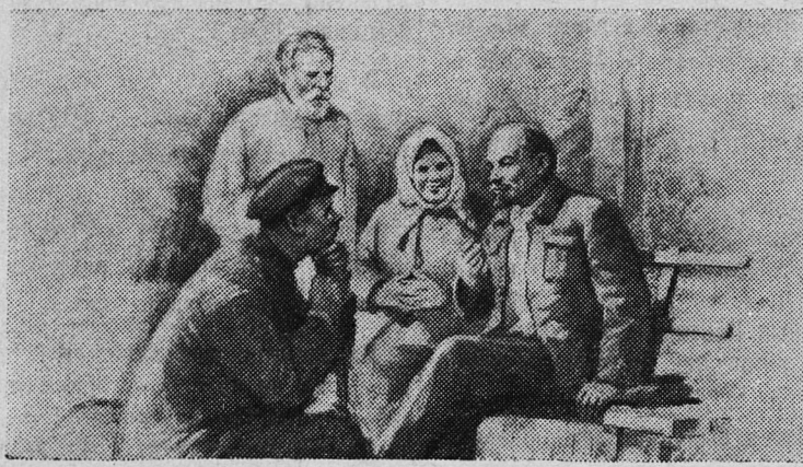
В. И. Ленин беседует с крестьянами.

— Взгляни на наши голые израненные ноги. У нас только лап-