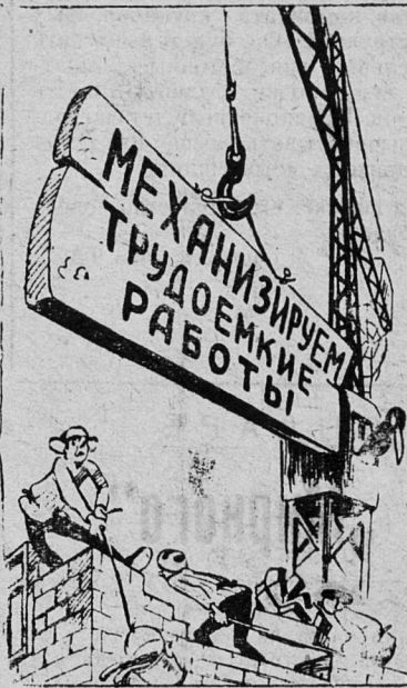
Наглядная агитация на высоте.

...что, если шахты комбината «Сланцы» будут экономить на каждой тонне добываемого сланца хотя бы по 10 копеек, то в год это составит 300 тысяч рублей.