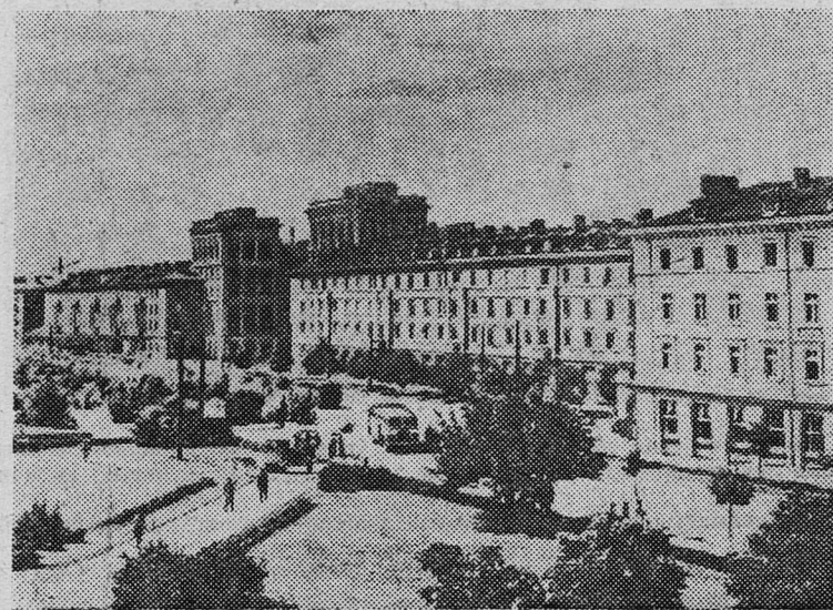
Народная Республика Болгария. Кварталы жилых домов в Димитровграде.

БУХАРЕСТ. (ТАСС). За активный вклад в дело свержения военно-фашистской диктатуры и установление народно-демократической власти, за особые заслуги в деле строительства социализма, за активное содействие укреплению народно-демократического строя Президиум Великого Национального Собрания РНР награждает орденами и медалями Румынской Народной Республики 10.977 человек. Среди награжденных орденом «23 августа» первой степени — Первый секретарь ЦК Румынской рабочей партии Г. Георгиу-Деж, председатель Президиума Великого Национального Собрания И. Г. Маурер и другие руководители Румынской рабочей партии и народного правительства, известные деятели науки и культуры.