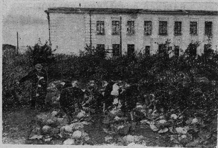
На снимке: юннаты средней школы № 1 на уборке урожая капусты с опытного участка школы.