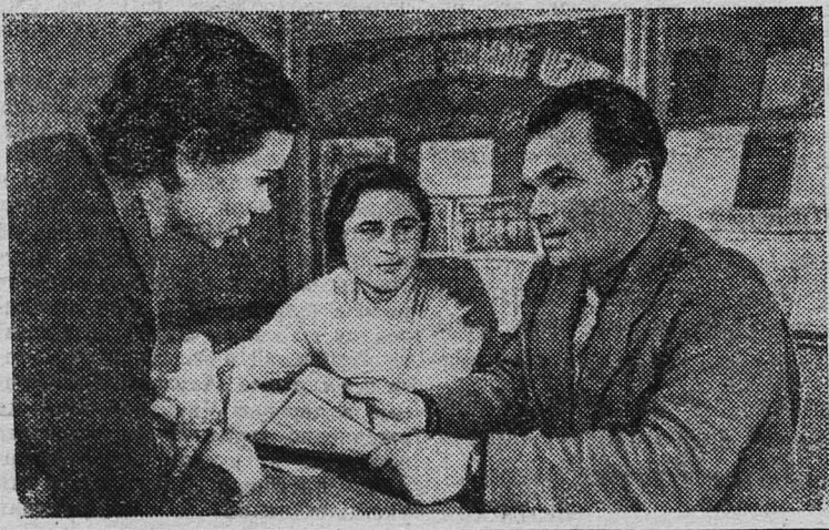
НИКОЛАЕВ. В строительном управлении № 14 треста «Николэвстрой» в сети политического просвещения занимается около 50 человек. Для них созданы семинары по экономике строительной промышленности, кружок по изучению истории КПСС.

заведующий отделом культуры исполкома городского Совета депутатов трудящихся.