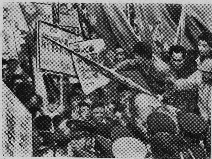
ЯПОНИЯ. Токио. 4 миллиона человек вышли на демонстрацию против пересмотра японо-американского «договора безопасности». Это восьмое по счету общественное выступление масс против пересмотра «договора безопасности».

НА СНИМКЕ: во время демонстрации.