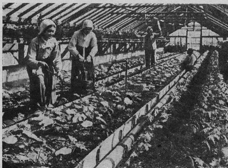
КОРЕЙСКАЯ НАРОДНО-ДЕМОКРАТИЧЕСКАЯ РЕСПУБЛИКА. Члены сельскохозяйственного кооператива имени Чо Ок Хи в уезде Пэчон (провинция Южный Хванхэ) круглый год выращивают помидоры, огурцы и другие овощи.