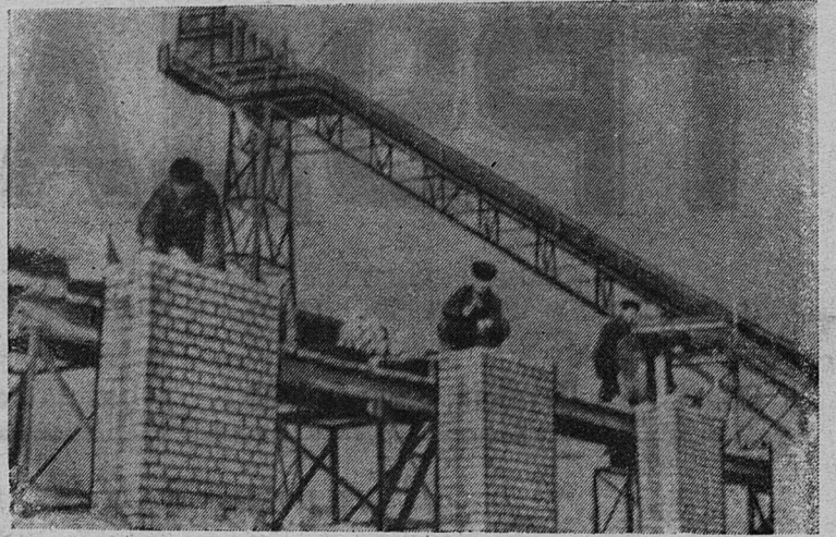
Рабочие Волховского алюминиевого завода получают в этом году 10 тысяч квадратных метров жилой площади. На снимке: строительство жилых домов на 125-м строительном участке гор. Волхова.