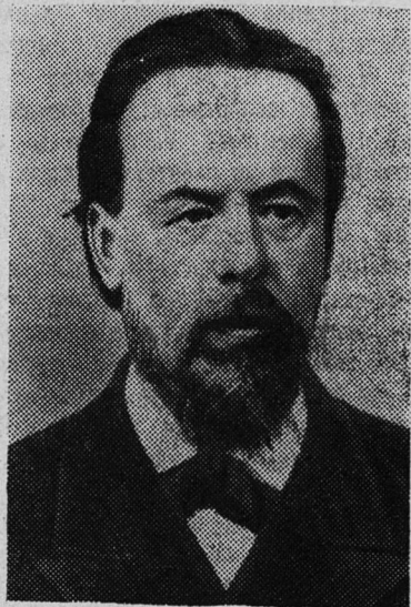
А. С. ПОПОВ.

Попов не гнушался физической работы. Об этом напоминает стоящий в зале токарный станок. На нем ученый постоянно мастерил