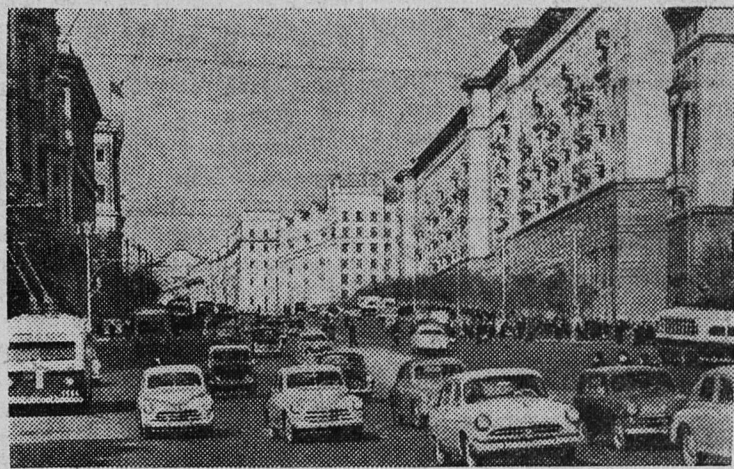
Москва сегодня. Улица Горького.