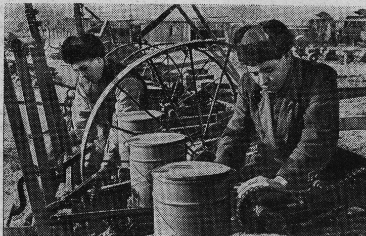
Чечено-Ингушская АССР. Успешно ведут подготовку сельскохозяйственной техники к весне колхозы и совхозы республики.

Механизаторы колхоза «Первое мая» Грозненского района решили к открытию XXI съезда КПСС закончить ремонт всех сельскохозяйственных машин.