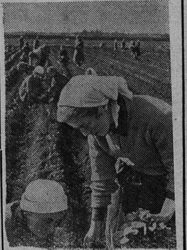
Учащиеся Мичуринского сельскохозяйственного училища № 52 проходят производственную практику в совхозе «Ручьи». Через несколько месяцев будущие животноводы и овощеводы после сдачи государственных экзаменов будут работать в совхозах Ленинградской области.

В совхозы Выборгского района выехали докладчики из числа партийного и советского актива района. С большим интересом слушают рабочие и специалисты сельского хозяйства доклады на тему: «Решения пятой сессии Верховного Совета СССР — новый шаг по пути строительства коммунистического общества в нашей стране». Этим же теме посвящены беседы, которые проводят около 200 агитаторов. В сельских библиотеках открылись выставки по материалам сессии.