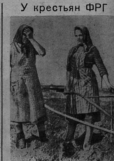
У крестьян ФРГ

Дом культуры комбината «Сланцы». Сегодня — беседа для пионеров и школьников «Современная реактивная техника», кинофильм «Колыбельная»; завтра — молодежный кинолекторий «А. И. Микоян в Кубинской республике»; послезавтра — кинофильм «Невские мелодии». Клуб «Шахтер». Сегодня — лекция «Как правильно организовать режим питания», хроникальные фильмы «Гимнастика миллионов», «О них заботятся»; завтра и послезавтра — кинофильм «Вечнодействующая радиоволна». Клуб шахты № 1. Сегодня — кинофильмы: для детей «Повесть о настоящем человеке», для взрослых «Вечнодействующая радиоволна»; завтра — вечер ветера-