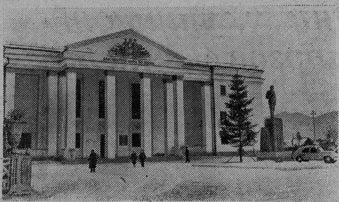
ПРИМОРСКИЙ КРАЙ. В поселке Северный Сучан открылся новый Дом культуры, которому присвоено имя Владимира Ильича Ленина. Зрительный зал Дома культуры рассчитан на 400 мест, создана библиотека, для занятий кружков оборудованы специальные помещения.

НА СНИМКЕ: Дом культуры имени В. И. Ленина в Северном Сучане.