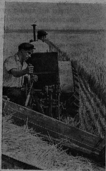
С каждым днем фронт уборочных работ продвигается все дальше на север. Началась жатва хлебов в Воронежской области. 11 тысяч гектаров зерновых предстоит убрать колхозу имени XX съезда КПСС Россошанского района. На отдельной уборке здесь работает 11 лафетных жаток.

ОРГАН СЛАНЦЕВСКОГО ГОРКОМА КПСС И ГОРОДСКОГО СОВЕТА ДЕПУТАТОВ ТРУДЯЩИХСЯ