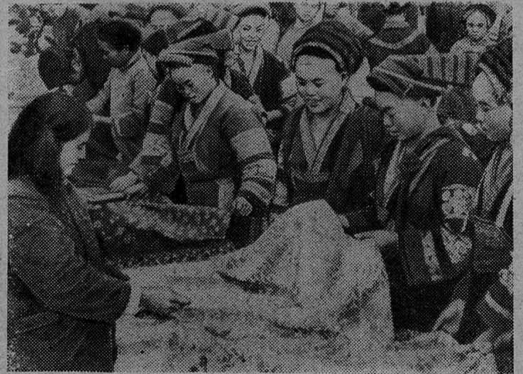
КИТАЙСКАЯ НАРОДНАЯ РЕСПУБЛИКА. Женщины — представительницы национальных меньшинств покупают ткани на сельском базаре в провинции Гуйчжоу (Юго-Западный Китай).