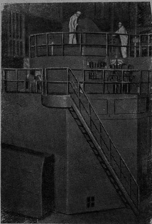
ЛЕНИНГРАД. Новый атомный реактор, построенный в Физико-техническом институте Академии наук СССР. Этот исследовательский водо-водяной реактор имеет номинальную мощность 10 тысяч киловатт с интенсивностью потока нейтронов 10 в четырнадцатой степени на квадратный сантиметр в секунду.