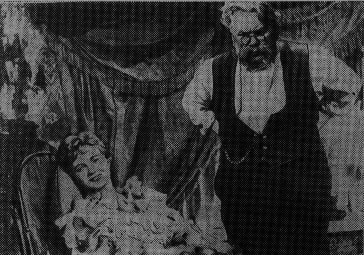
Кадр из нового художественного кинофильма «Месть». Сценарий Г. Колтунова по рассказу А. П. Чехова. Производство киностудии «Мосфильм» 1960 года.