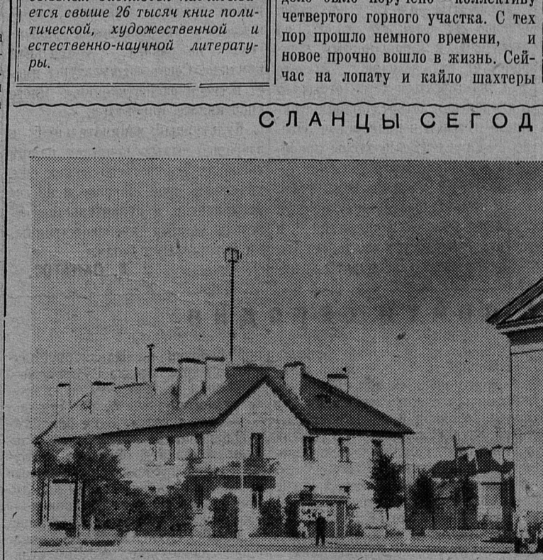
На снимке: на площади у клуба горняков.