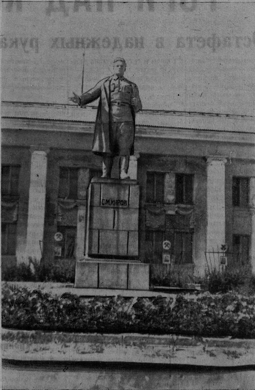
На снимке: памятник С. М. Кирову в Сланцах.

Часы начала работы сессии и повестка не изменяются.