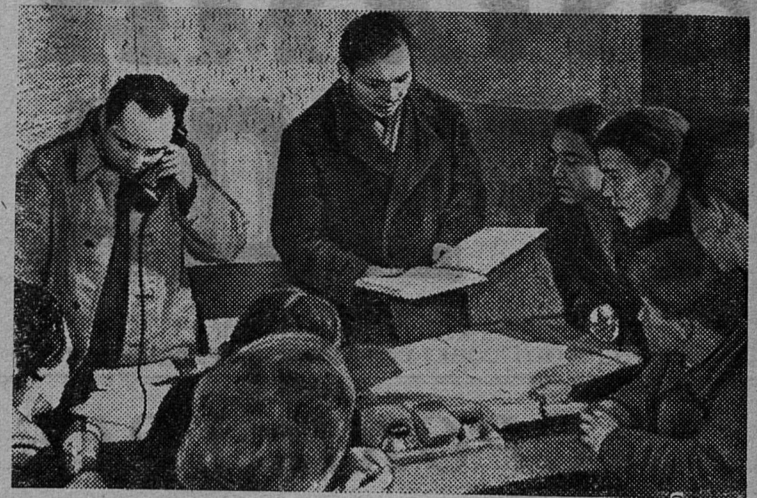
ЭСТОНСКАЯ ССР. Успешно идут работы на строительстве Прибалтийской ГРЭС — самой мощной в мире электростанции на сланцах. Эта стройка — ударная комсомольская.

В этом году был досрочно пущен второй турбогенератор. Полным ходом ведется монтаж четвертого котла. Энергия станции уже направляется потребителям в Ленинград и Таллин.