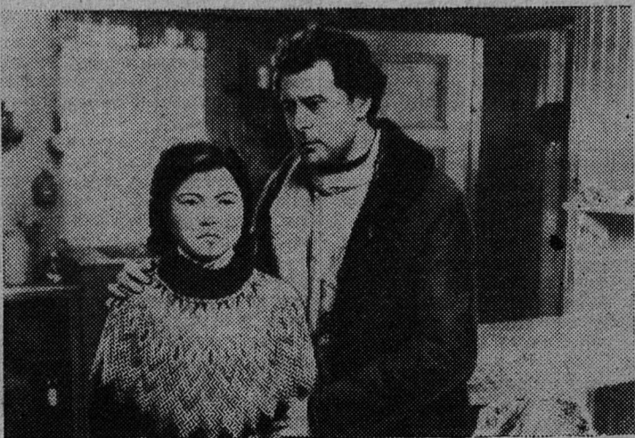
Кадр из датского художественного фильма «Легенда о беглеце».