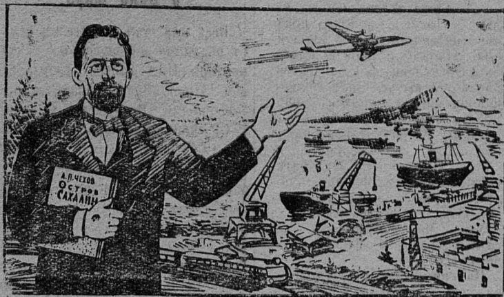
Рис. В. Жаринова.