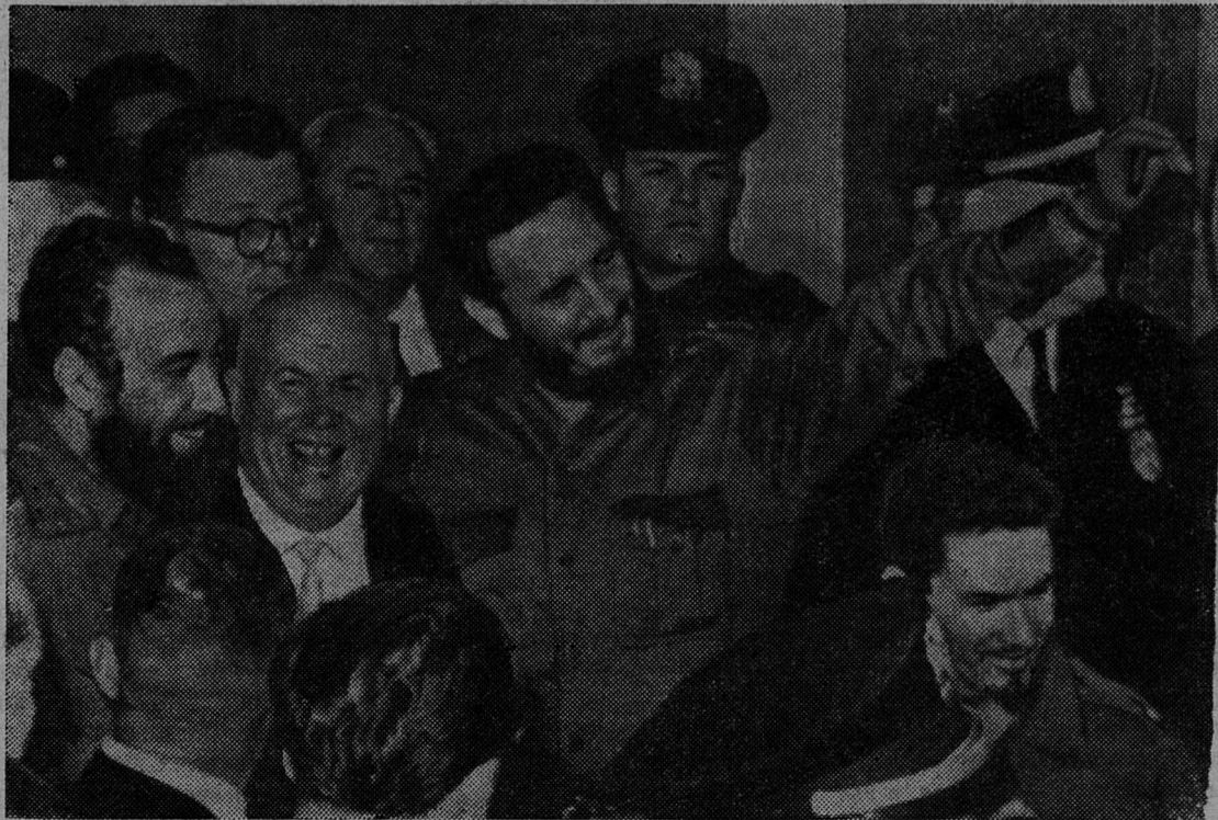
Нью-Йорк. 20 сентября. Встреча Н. С. Хрущева с Премьер-Министром Кубинской Республики Фиделем Кастро в отеле «Терезия» в Гарлеме.