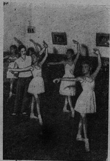
На занятиях в балетной школе в Пекинском Дворце пионеров.