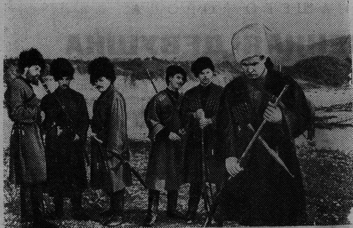
Чечено-Ингушская АССР. Студия «Мосфильм» ведет в республике съемки художественного цветного фильма «Казачи» по одноименной повести Л. Н. Толстого. Именно здесь разворачивалось действие повести. В основных ролях заняты артисты Б. Андреев, З. Кириенко, Л. Губанов, Э. Бредун. Сценарий написал В. Шкловский, режиссер-постановщик — В. Пронин, оператор — И. Гелейн.