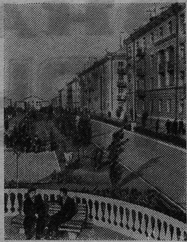
ЛУГАНСКАЯ ОБЛАСТЬ. Неподалеку от города Краснодона строится поселок Молодогвардейск. Здесь живут горняки близлежащих шахт, шахтостроители и те, чьими руками возводится этот поселок. НА СНИМКЕ: улица им. Ленина в новом горняцком поселке.