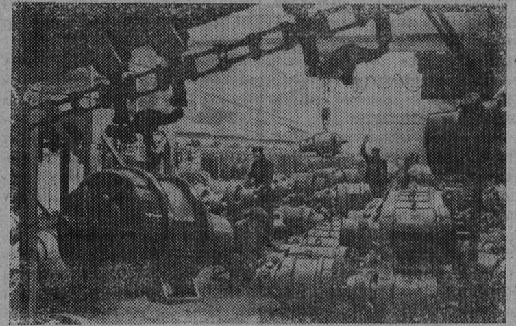
НА СНИМКЕ: генераторный цех Армянского электромашиностроительного завода.