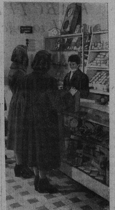
Украинская ССР. В Винницкой области с каждым годом улучшается торговля на селе, все больше сооружается магазинов, чайных, предприятий бытового обслуживания. В районном центре Калиновке открыт новый универсальный магазин, в котором имеются отделы готовой одежды, тканей, обуви, детской одежды, галантереи, парфюмерии, культтоваров. На снимке: в новом универсаме села Калиновки.

ТБИЛИСИ. (ТАСС). Энергостроители Грузии завершили сооружение 330-киловольтной линии передачи, соединяющей подстанцию в Акстафе (Азербайджан) с Атарбекянской ГЭС Севано-Разданского каскада (Армения). Уже более месяца по этой высоковольтной линии протяженностью свыше 120 километров, проходящей на ряде участков на высоте 1.500—2.000 метров над уровнем моря, излишки электроэнергии из Азербайджана поступают в Армению. Линии электропередачи такого же напряжения соединяют крупнейшую гидроэлектростанцию Азербайджана — Мингечаурскую с Тбилиси и столицу Грузии с мощной ГЭС республики — Ладжанурской, сданной в эксплуатацию во втором году семилетки. Таким образом создано энергетическое кольцо трех республик Закавказья.