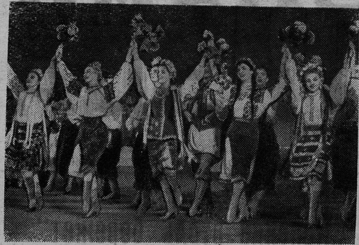
МОСКВА. 12 ноября в день открытия декады в помещении Концертного зала имени П. И. Чайковского состоялся концерт Государственного заслуженного ансамбля танца УССР. Художественный руководитель — народный артист УССР Павел Вирский.

НА СНИМКЕ: ансамбль исполняет хореографическую картину «Красная калина».