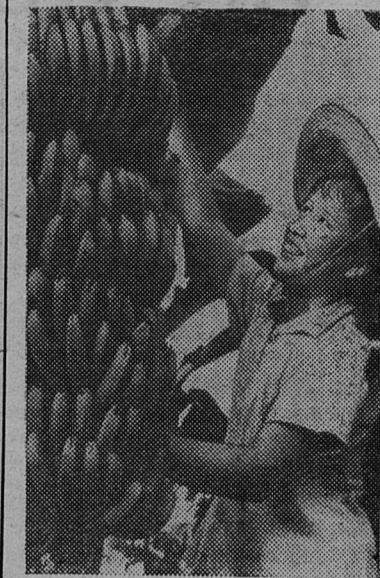
КИТАЙСКАЯ НАРОДНАЯ РЕСПУБЛИКА. Уезд Дуван в провинции Гуандун известен своими обширными банановыми плантациями. В этом году здесь созрел богатый урожай.

Дружба китайского и советского народов, пишет газета, непрерывно развивается и укрепляется. За 11 лет существования КНР были достигнуты огромные успехи в сотрудничестве Китая и Советского Союза в области политики, экономики и культуры. Огромную помощь социалистическому строительству в Китае оказал Советский Союз. Китайский народ никогда не забудет этой огромной помощи.