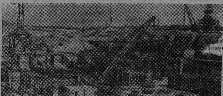
Киргизская ССР. На крупнейшей стройке республики — Уч-Курганской ГЭС — с опережением вафика идет строительство основных гидросооружений. Досрочно начат монтаж второго агрегата.

На снимке: строительство Уч-Курганской ГЭС.