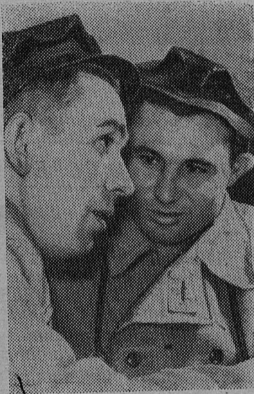
Луганская область. Горняки треста «Боковоантрацит» первыми в Донбассе достигли уровня производительности труда, запланированного на конец семилетки. Теперь каждый рабочий в среднем по тресту добывает столько угля, сколько намечено на 1965 год.

Советский депутат является государственным деятелем и обязан принимать активное участие в работе Совета, в который он избран, выполнять поручения, данные ему Советом. Это закономерно. Совет есть коллективный орган и успех его деятельности зависит от активности и инициативы, постоянного участия в его работе каждого депутата.