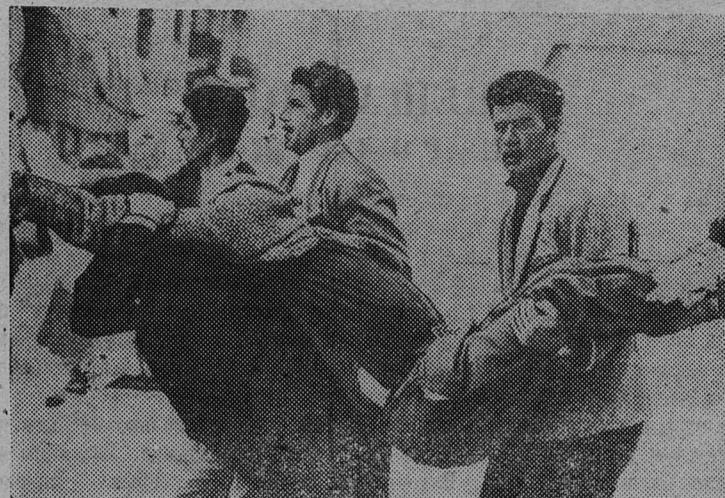
ГРЕЦИЯ. В начале декабря была проведена всеобщая забастовка афинских строителей. Отряды полиции и жандармерии напали на бастующих с дубинками и пустили в ход бомбы со слезоточивым газом. В районе центральной площади Омони разыгралось настоящее сражение. Было ранено свыше ста человек.

НА СНИМКЕ: строители уносят раненого товарища.