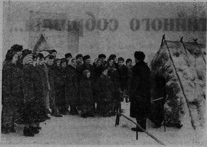
ЛЕНИНГРАД. 22 апреля исполняется 90 лет со дня рождения великого вождя и учителя трудящихся, основателя Коммунистической партии и Советского государства В. И. Ленина. Трудящиеся Ленинграда и области с огромным интересом посещают музеи и исторические места, связанные с жизнью и деятельностью великого вождя.

НА СНИМКЕ: группа экскурсантов у шалаша В. И. Ленина в Разливе.