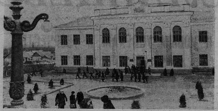
МОЛДАВСКАЯ ССР. В селе Копанке Бендерского района на средства колхоза имени Ленина построено здание средней школы. Колхоз помог оборудовать лаборатории и кабинеты, выделил два гектара земли для школьного огорода.

НА СНИМКЕ: здание новой средней школы в селе Копанке.