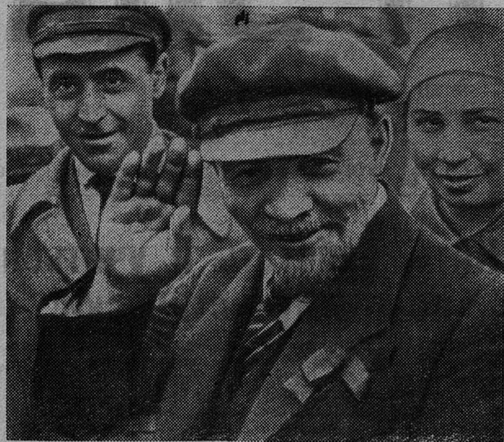
В. И. Ленин на закладке памятника «Освобожденный труд». Москва. 1 мая 1920 года (кинокадр).