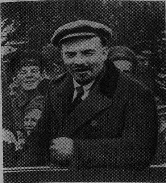
В. И. Ленин у рабочих Рублевской водокачки. 1 мая 1919 года (кинокадр).

(Из альбома, подготовляемого к выпуску Институтом марксизма-ленинизма при ЦК КПСС).