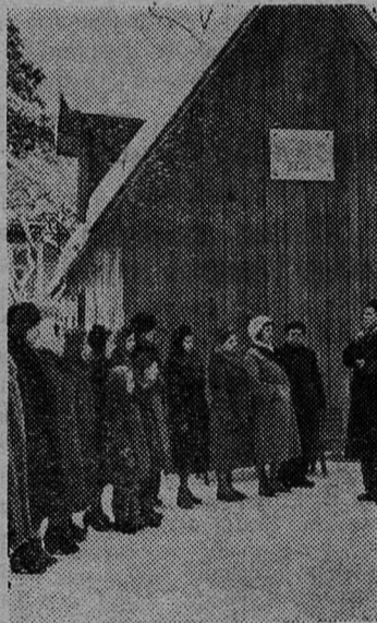
Трудящиеся Ленинграда и области с опромным интересом посещают музеи и исторические места, связанные с жизнью и деятельностью великого вождя.

Целый день не умолкают голоса на исторической поляне в Разливе. Пока одни рассматривают музейную экспозицию, другие вчитываются в слова, высеченные на памятнике, ведут тихую беседу об этом памятном месте, которое только в прошлом году посетило свыше 200 тысяч человек. Свои впечатления экскурсанты оставляют в большой книге. На русском и многих других языках мира трудящиеся, дети, офицеры и солдаты, делегации из зарубежных стран оставляют записки, проникнутые безграничной любовью к великому вождю, преданностью бессмертному делу Ленина. Советские люди заявляют о своей готовности бороться под руководством Коммунистической партии за торжество коммунизма.