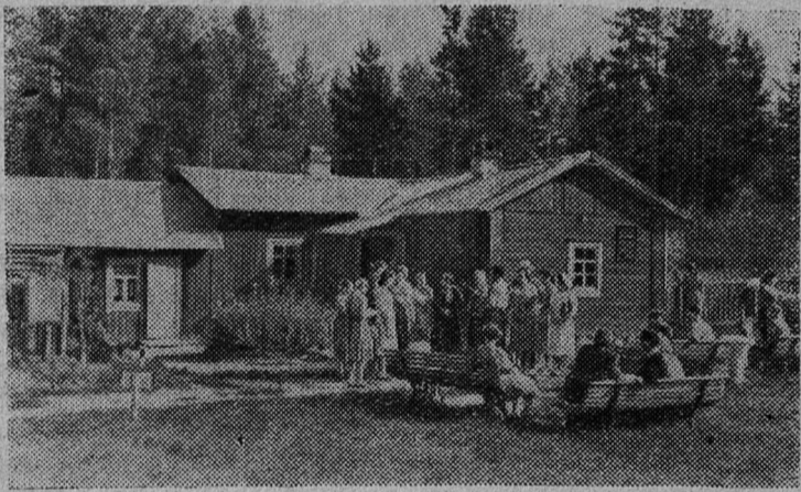
На снимке: экскурсанты в Ильичево.

Сотни экскурсантов бывают в эти дни в поселке Ильичево. С глубоким интересом они осматривают исторический домик, проходят мимо двух высоких сосен и березы, рядом с которыми, сидя на камне, Ленин делал наброски своих статей. «Мы будто воочию увидели живого Ленина, — сказали молодые рабочие завода имени Второй пятилетки, побывавшие в этих местах. — Мы уносим отсюда светлую память о великом и вечно живом человеке».