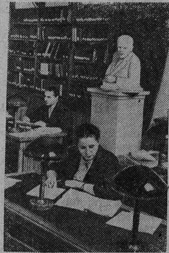
ЛЕНИНГРАД. Владимир Ильич Ленин в своих научных трудах широко использовал книги и литературные материалы Государственной Публичной библиотеки и был постоянным ее читателем в 1893—95 годах. На здании Публичной библиотеки имени М. Е. Салтыкова-Щедрина установлена мемориальная доска. Зал № 34, где постоянно работал Владимир Ильич, назван «Ленинским залом». НА СНИМКЕ: в Ленинском зале.