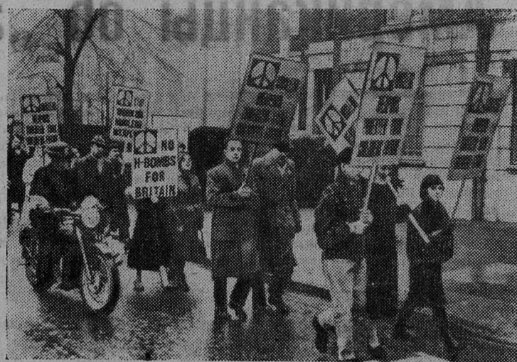
ЛОНДОН. Демонстрация протеста против производства ядерного оружия.

Демонстранты несут плакаты «Англии не нужны водородные бомбы», «Ядерное оружие угрожает будущему ваших детей».