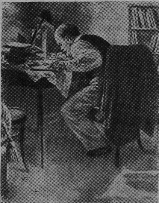
«Июль 1917 г. В. И. Ленин в подполье». (Рис. художника Е. А. Кибрика).

Изредка Ильич поздними вечерами выходил на прогулку, а 10 (23) октября 1917 года ушел на заседание ЦК партии, которое состоялось в квартире № 31 дома № 32-1 по набережной реки Кар-