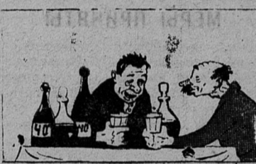
Они сначала обменялись «Опыт» за столом...