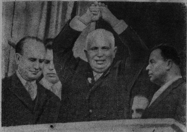
Председатель Совета Министров СССР Н. С. Хрущев в Париже. На снимке: Н. С. Хрущев отвечает на приветствия с балкона здания на Кэ д'Орсэ, являющегося его резиденцией в столице Франции.

(Снимок принят по фототелеграфу)