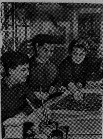
ЛЕНИНГРАД. С каждым годом расширяется ассортимент тканей, выпускаемых ситценабивной фабрикой имени Веры Слуцкой.