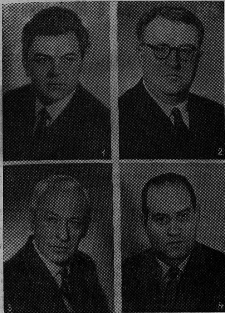
1. Сергей Бондарчук 2. Георгий Свиридов 3. Роман Карман 4. Давид Ойстрах