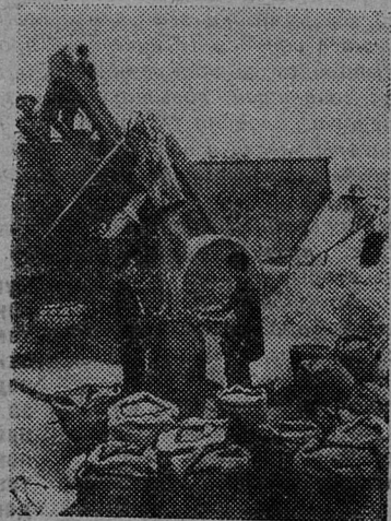
КИТАЙСКАЯ НАРОДНАЯ РЕСПУБЛИКА. В провинции Хубэй уборка пшеницы в полном разгаре. В этом году урожай выше, чем в прошлом.

Это равносильно заявлению, что Бельгия не намерена вывести свои войска с баз.