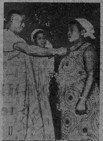
Правительство Ганы организовало для женщин во всех районах страны бесплатные курсы по ведению домашнего хозяйства и уходу за детьми. Таким путем частично возмещается недостаток образования у женской части населения. В годы длительного господства иностранных империалистов женщины не имели права посещать школы.

НА СНИМКЕ: на уборке.