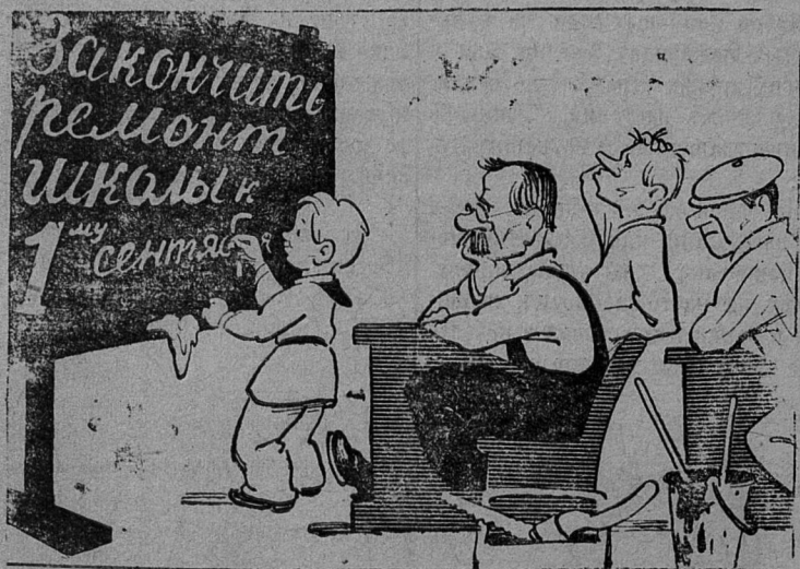
Перед окончанием каникул.