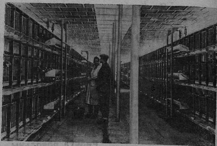
ЧЕХОСЛОВАЦКАЯ РЕСПУБЛИКА. Птицеферма госхоза Стадце. Несушки здесь содержатся в специальных клетках.