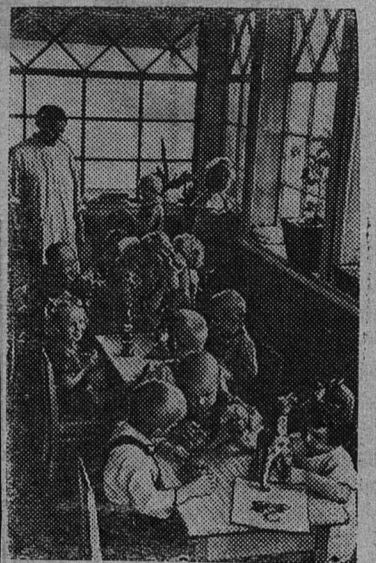
В комнате игр детского сада совхоза «Большевик» Колпинского района.