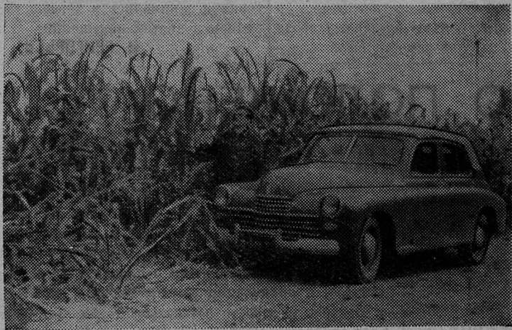
Вот такая кукуруза была выращена нынче на полях колхоза «Май».

Агрономам совместно с бригадами-полеводцами и звеньевыми составить по каждому звену хорошо продуманный план агротехнических мероприятий по выращиванию кукурузы, организовать учебу кукурузоводов, сочетать теоретические занятия с практической работой, глубже изучить методы труда передовых звеньев и настойчиво внедрять их в практику сельскохозяйственного производства. Выполняя эти мероприятия, мы заложим прочную основу высоких урожаев в третьем году семилетки.