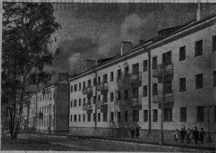
Фото и текст Н. ШАЙДУЛИНА.

В начале сентября этого года в новом трехэтажном доме, расположенном по улице Свердлова, справили новоселье десятки семей строителей города Сланцы. В квартирах имеются центральное