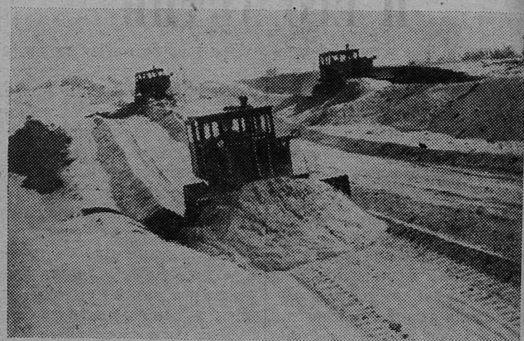
ТУРКМЕНСКАЯ ССР. Среди барханных песков в междуречье Мургаба и Теджена развернулось сооружение второй очереди Кара-Кумского оросительного канала. Это важное строительство объявлено народной стройкой. Сейчас строители трудятся с большим подъемом. Они стремятся открыть путь воде по новому руслу от Мургаба до Теджена к 43-й годовщине Великого Октября.

НА СНИМКЕ: бульдозеры ярусным способом разрабатывают участок трассы канала.