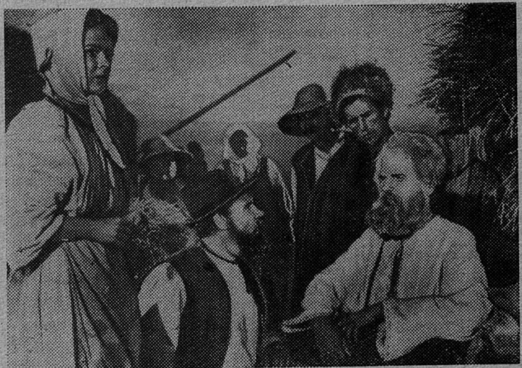
Кадр из нового художественного фильма «Таврия». Производство киностудии имени А. П. Довженко.