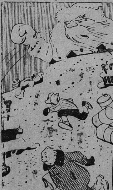
Ахи, охи — слышны вздохи Среди общей суматохи... — Отчего переполох? — Дед-мороз застал врасплох!