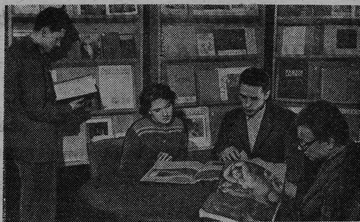
МОСКВА. В залах Всесоюзной государственной библиотеки иностранной литературы открыта книжно-иллюстративная выставка о французском искусстве. Представлено несколько сот экспонатов. Посетители знакомятся с книгами и другими материалами, посвященными творчеству старых и современных французских мастеров. На выставке имеются разделы «Франция в иллюстрациях», «Архитектура Франции», а также разделы, посвященные музыке, театру, кино, скульптуре, графике, живописи.