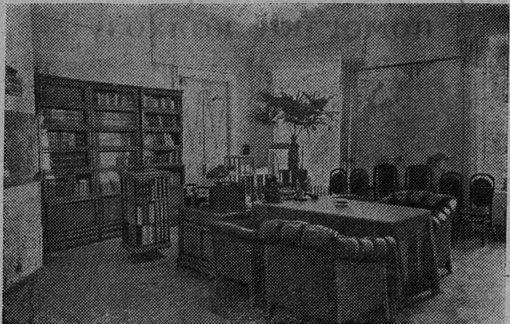
Москва. Кремль. Рабочий кабинет В. И. Ленина.