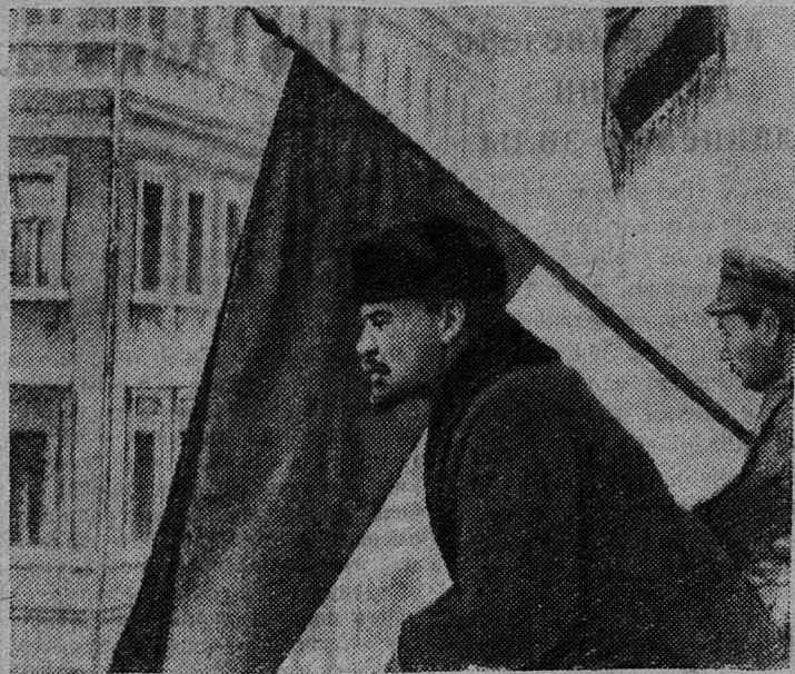
В. И. Ленин выступает с балкона Моссовета с приветствием перед бойцами - коммунистами, отправляющимися на борьбу с Деникиным.