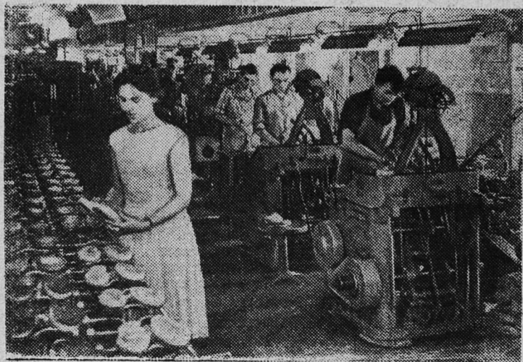
ЛАТВИЙСКАЯ ССР. Большие перемены произошли в период между XXI и предстоящим XXII съездами КПСС на рижской обувной фабрике «Первое мая». Два года назад на предприятии почти отсутствовала механизация, сейчас полностью завершена механизация и конвейеризация производства. За это время выпуск обуви значительно увеличился. Готовясь достойно встретить партийный съезд, обувщики за пять месяцев дали сверх плана 10 тысяч пар обуви.

Партийное собрание избрало новый состав партбюро, наметило меры для устранения недостатков и дальнейшего улучшения партийной работы на шахте № 2.