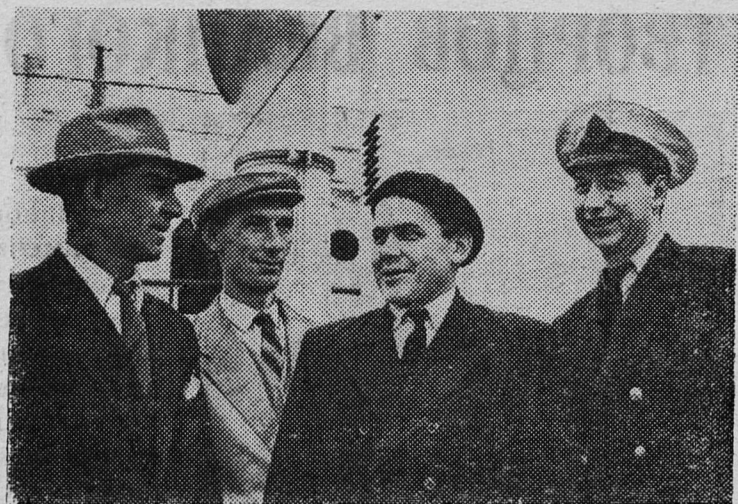
ЛЕНИНГРАД. Моряки Балтийского пароходства несут трудовую вахту в честь XXII съезда КПСС. Экипажи судов, перевозящие грузы в порты зарубежных стран, заканчивают рейсы с опережением графика, доставляют тысячи тонн сверхплановых грузов. За высокие показатели экипажу теплохода «Грибоедов» присвоено звание экипажа коммунистического труда.